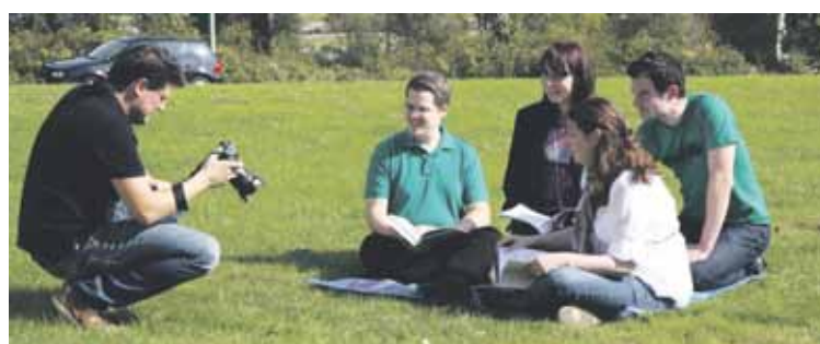
Ein Shooting, das allen Spaß gemacht hat – vor und hinter der Kamera von Cris Dahm (l.)

„Eine bunte Mischung der Geschlechter und Haarfarben“, will Cris Dahm für das erste Motiv, einer Gruppe von Studierenden in einer Lernsituation. Auf dem Tisch liegt eine Auswahl von Studienbriefen und Fachbüchern. Während die Models vor der Kamera den Anweisungen des Fotografen folgen, kommen diejenigen, die gerade Pause haben, miteinander ins Gespräch. „Woher kommst du, was studierst du und in welchem Semester?“ Es wird viel gelacht und die Stimmung ist ausgelassen – die beste Voraussetzung für einen ent-