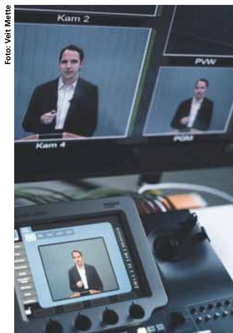
Allein vor der Kamera: Auch für Lehrende sind Online-Vorlesungen zunächst natürlich noch ungewohnt.

Zugleich Lernen und Kommunizieren: Auch das macht das virtuelle Klassenzimmer durch synchrones E-Learning möglich. Zusätzlich zu