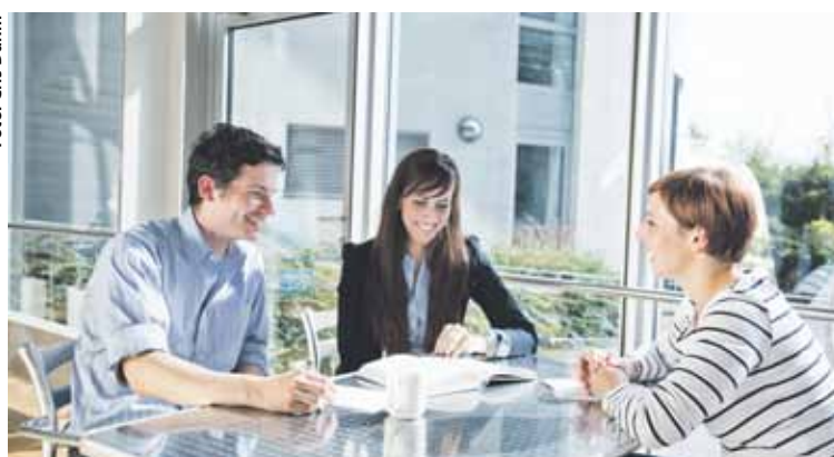
Einzelkämpfer? Teamplayer? Viele FernUni-Studierende sind beides.