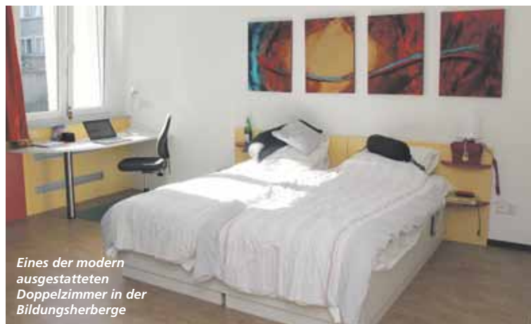
Eines der modern ausgestatteten Doppelzimmer in der Bildungsherberge