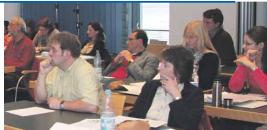
154 Studierende der Geschichte kamen zur 4. Geschichtswoche nach Hagen.

Zu den daran anschließenden Stationen gehörten u.a. Königliches Schloss, Reichstagsgebäude und Historisches Museum. Besonders interessant und aufschlussreich war hier die Dauerausstellung „Die Geschichte Schwedens 1000 - 2000“, die der Gruppe einen guten Allgemeinüberblick über die Entwicklung Schwedens in der Zeit von 1750 bis 1950 gab. MF